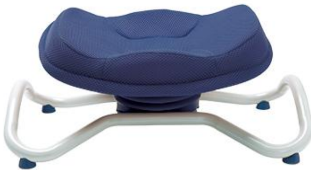
ネイビー：ショップジャパン インターネット通販限定カラー