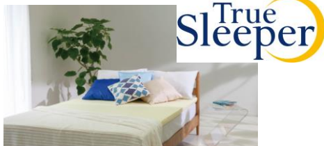
イメージ画像：トゥールスリーパー

そこで「トゥールスリーパー」では、もっと多くの方々に睡眠への関心を持っていただくべく、“働き世代”層をターゲットとした「いつでも」「どこでも」がコンセプトのカジュアルリラクゼーションスペース「てもみん」に特注の商品を提供いたします。“働き世代”の方々に「トゥールスリーパー」をご体験いただき、寝具への関心や睡眠の質向上への興味が高まることで、より豊かなライフスタイルの実現をお手伝いいたします。