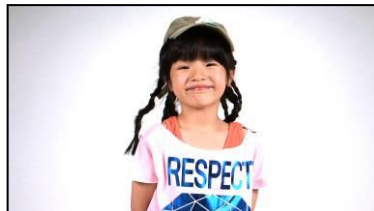
「TRF イージー・ドウ・ダンササイズ 見よう見まねで踊ってみた」