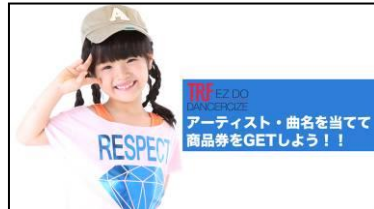
テロップ:アーティスト・曲名を当てて商品券をGETしよう!!