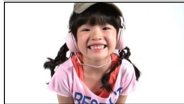
「誰のダンササイズでしょうか」