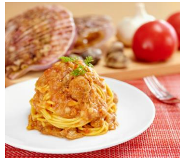
ヒルズダイエット「 Pasta de スリム」 盛り付けイメージ