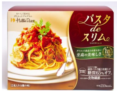
ヒルズダイエット「 Pasta de スリム」 パッケージ写真