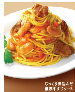
じっくり煮込んだ 濃厚牛すじソース

ヒルズダイエット「 Pasta de スリム」の盛り付けイメージ。4種類（左から、魚介とトマトのマリナーソース、根菜とベーコンの豆乳クリームソース、贅沢トマトのオマール海老&かにソース、じっくり煮込んだ濃厚牛すじソース）3セットずつ入り、合計12個入り1箱。