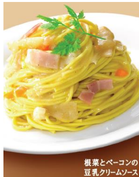
根菜とベーコンの 豆乳クリームソース