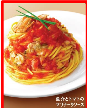
魚介とトマトの マリナーソース

この商品は、ダイエット食品とは思えない至高の美味しさを味わいながらカロリーを平均約210kcalに控えた、まったく新しいダイエット Pasta です。ダイエットで食事の量や食べたいものを制限してみたけれど、空腹感や美味しいものを我慢できずに、挫折してしまう方にぴったりの一品です。1日の食事のうち1～2食をヒルズダイエット「 Pasta de スリム」に置き換えることで1日の総摂取カロリーがスリムになります。