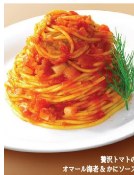
贅沢トマトの オマール海老&かにソース