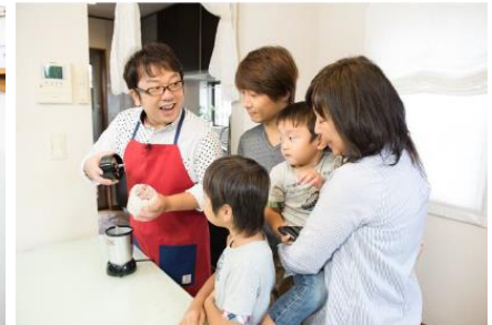
料理にお悩みをもつご家庭に突撃し、マジックブレット デラックスを使用して「ヘルプ飯」を披露する天野ひろゆきさん