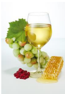
◀ ハニーワイン発酵エキス ※2