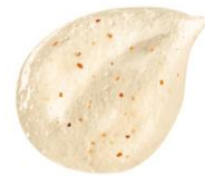
ローズマリー & シダーウッドの さわやかな香り（天然香料）