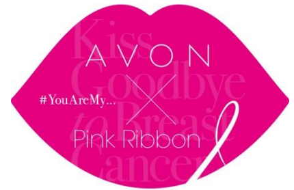
(左)“Kiss Photo Space”イメージ(右)Kiss Goodbye to Breast Cancerステッカー