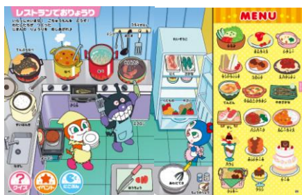
料理の道具の名前を覚えたり、料理をつくるゲームで二語文を学びます。