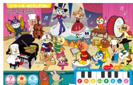
色んな楽器の名前や音を覚えることができます。鍵盤で演奏も。