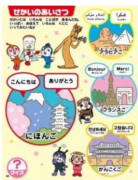
世界のいろいろなことばで、「こんにちは」「ありがとう」を学びます。