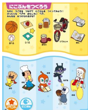
上下のことばを組み合わせ、二語文を学びます。