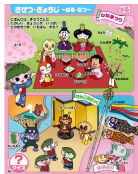
各季節の行事にまつわることばを覚えられます。