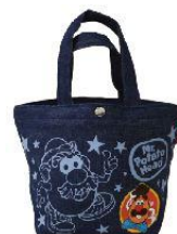
株式会社サンタン