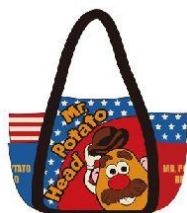
株式会社スモール・プラネット