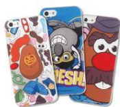
株式会社グルマンディーズ