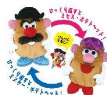
サンスター文具株式会社