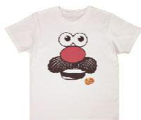
クルーズカンパニー株式会社