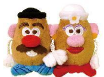
株式会社ケイカンパニー