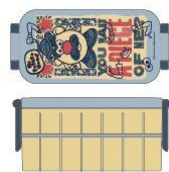
スクーター株式会社