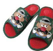
マルチウ産業株式会社