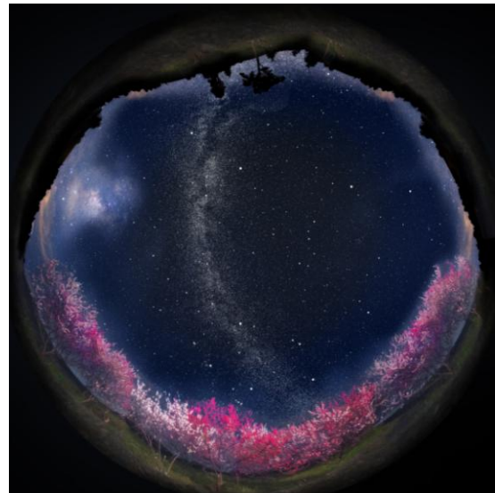
ホームスター阿智村限定 ver.から投影される、 日本一の星空と阿智村の風景

2005年7月、プラネタリウム・クリエイターの大平貴之氏が監修し、世界初の光学式家庭用プラネタリウムとして発売を開始。2008年には約12万個の星を投影出来るシリーズ最上位モデルが登場し、その後、オーロラが投影できるシリーズやキャラクターやアーティストとのコラボレーションモデルなど多くの話題商品が販売さ