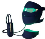
ブルーグリーンマスク