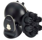
ヴェーダニードルスパ BS for Salon