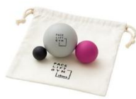
FACE LIFT GYM リリースボール