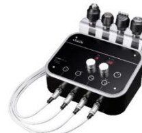
クイーンリフト for Pro 2