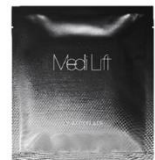
メディリフト 3D マイクロファイバー