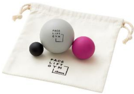
FACE LIFT GYM リリースボール