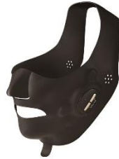
メデリフト プラス