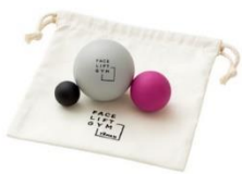
FACE LIFT GYM リリースボール

※立体的に肌を診断する3D肌測定&カウンセリング/スタッフによるスチームクレンジングを行います。