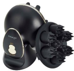
ヴェーダニードルスパ BS for Salon