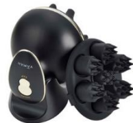
ヴェーダニードルスパ BS for Salon