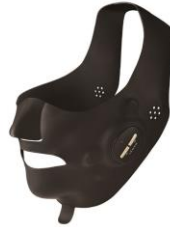
メディリフト プラス