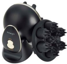
ヴェーダニードルスパ BS for Salon