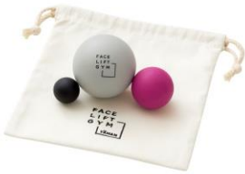
FACE LIFT GYM リリースボール