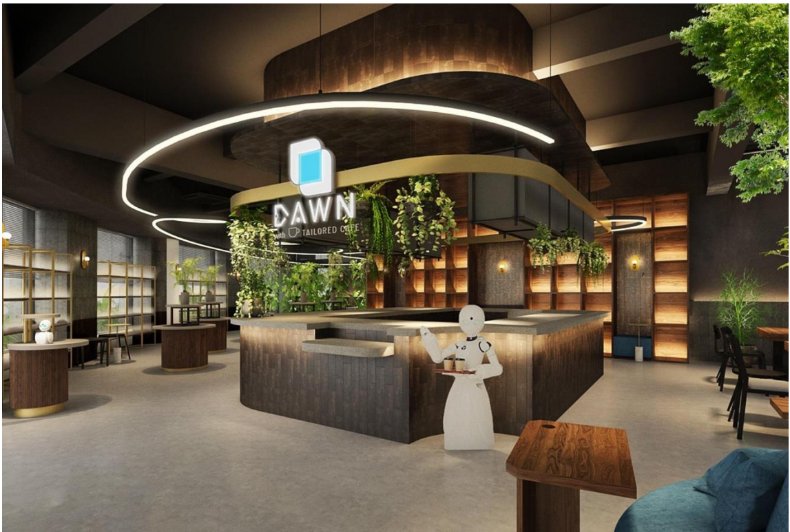
<エントランスイメージ>

2021年6月21日(月)注目の日本橋EASTエリアに グランドオープン！一般営業開始は6月22日。 店内イメージや営業情報、「テレバリスタ」の導入なども発表。