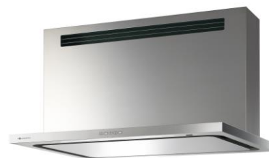
FEDL-RK-952S (壁面取付けタイプ)