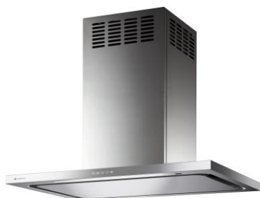
FEDCL-RK-952S (壁面取付けタイプ)