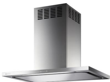
CFEDL-RK-952S (天井取付けタイプ)