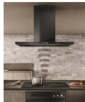
加熱機器連動機能