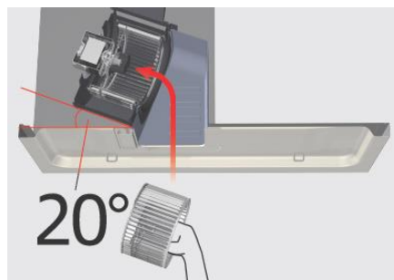
ななめファンユニット