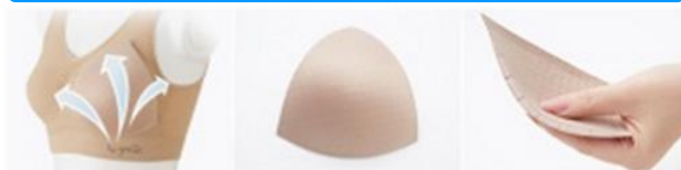
エアスルーカップ