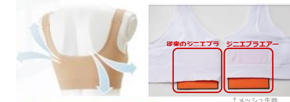
従来のジニエブラ ジニエブラエアー