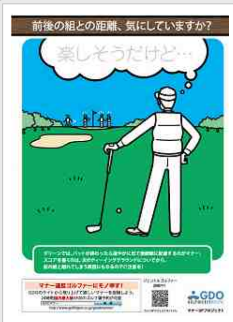
【ポスター イメージ画像】

近年のゴルフブーム、及びプレースタイルの多様化に伴い、プレー中や観戦中のマナー違反が問題視されています。GDOでは、ゴルフに関わる全ての人々が、快適にゴルフができる環境の実現を目指し、本プロジェクト活動を通じて、全国のゴルファーに対しマナーレベルの向上を呼びかけてまいります。