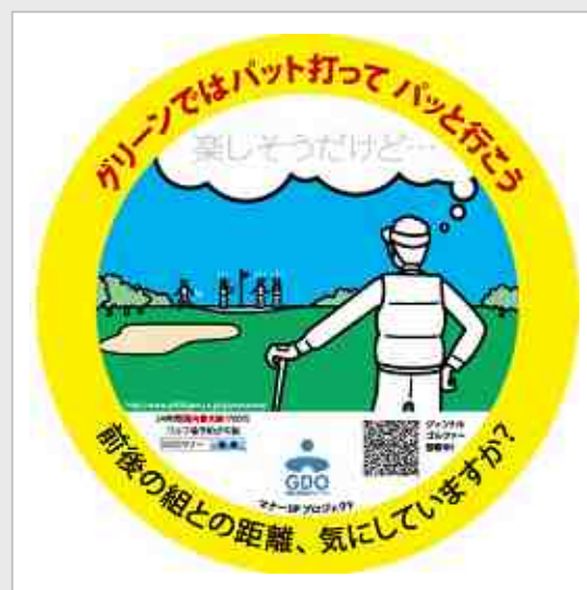
【ステッカー イメージ画像】

GDO は、今後ともゴルファーのマナーアップ向上施策を推進し、ゴルフ市場の活性化を推進してまいります。