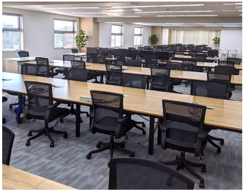
オペレーションルーム