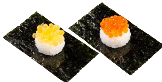
いくら包み食べ比べ（つきみいくら・いくら） 二貫 319円（税込）