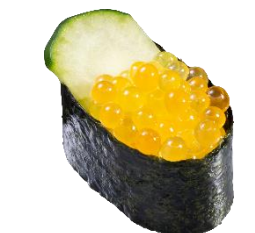
つきみいくら軍艦 一貫 209円（税込）