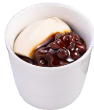
桔梗信玄餅風きな粉プリン ～特製黒蜜がけ～ 297円（税込）

山梨県の老舗和菓子屋「桔梗屋」オリジナルのきな粉を使用し豆乳ベースで仕立てた、滑らかな口当たりと弾力のある食感が楽しめるプリンです。北海道産小豆を使用した、程よい甘みのゆであずきと、「桔梗屋」特製のとろみある黒蜜をトッピングしました。きな粉の豊かな風味と濃厚でコクのある黒蜜の味わいが楽しめます。