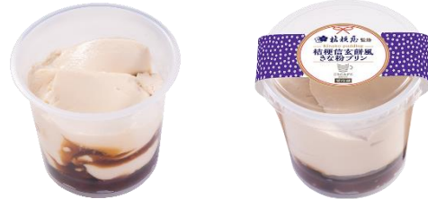
桔梗信玄餅風きな粉プリン～特製黒蜜使用～ お持ち帰り価格 320円（税込）