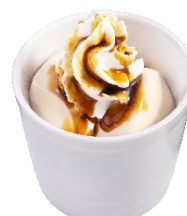
桔梗信玄餅風きな粉ホイッププリン ～特製黒蜜がけ～ 297円（税込）