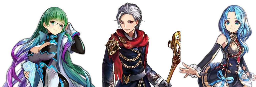
<左：★3バージョン「メーヴェル」 中央：★3バージョン「フェルムハイン」 右：★3バージョン「リュシカ」>