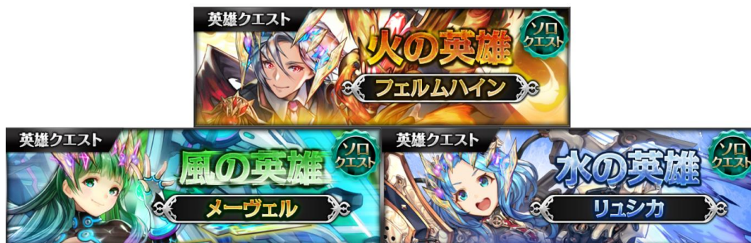
<各種の英雄クエスト>