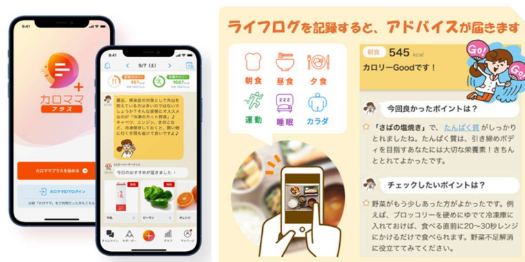
図 3 AI 健康アプリ「カロママ プラス」

ができる AI 健康アプリです。ライフログを記録することで、パーソナル AI コーチ「カロママ」から、専門家監修のアドバイスがリアルタイムで届きます。