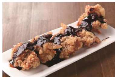
からあげ黒酢ソース(加納食堂からあげセンター加納)