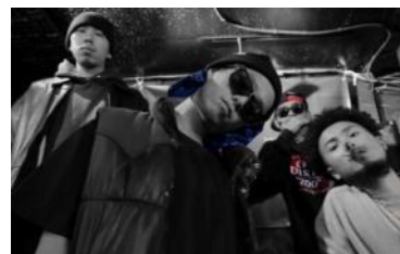
DINARY DELTA FORCE

2002年、地元湘南にてREGGAE MUSICに出会い、本格的に活動を始め。NEW YORK, MIAMI、ジャマイカでの活動を経て、2013年は日本全国にて年間100回以上の公演に出演。