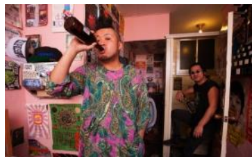
サイプレス上野とロベルト吉野

「ジャパニーズ・レゲエ」という言葉すらなかった頃から、いち早くメジャーフィールドに切り込み、常にシーンを切り開いて来た第一人者。人気・知名度共に日本最高峰のレゲエ・シンガーとしてその存在を確立。2014年には新曲「しあわせのかけら ～Love Song～」をリリースした。