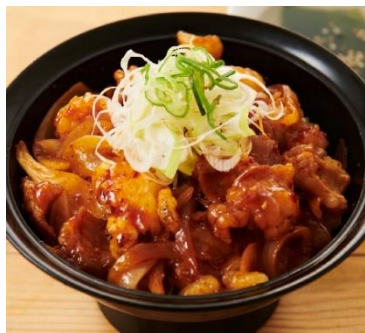
■旨辛ホルモン丼 830円（税込913円）

女性に人気の梅しそ冷麺は、梅の甘酸っぱさと大葉の香りが冷麺とマッチした人気のメニュー。牛肉と魚介の旨味が凝縮している石鍋豆腐チゲは、余韻が残る塩味が特徴の逸品です。