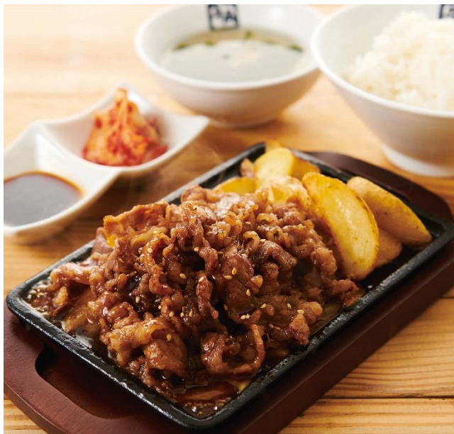
■カルビ焼き定食 890円（税込979円）

コロナイドグループの株式会社レイنزインターナショナルでは、2023年6月21日（水）に国内21店舗目となる「牛角焼肉食堂」をイオンモール大高にてオープンします。