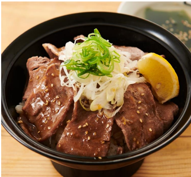
■ねぎ塩豚タン丼 790円（税込869円）

焼肉チェーン店で店舗数No.1を誇る牛角がプロデュースする「牛角焼肉食堂」。フードコートで牛角の味が1,000円以下で味わえます。熱々の鉄板で提供する焼肉定食を始め、ボリュームのある丼や冷麺、チゲなどのバリエーション豊かなメニューを取り揃えています。