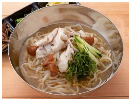
■梅しそ冷麺 （3種ナムル付き） 790円（税込869円）