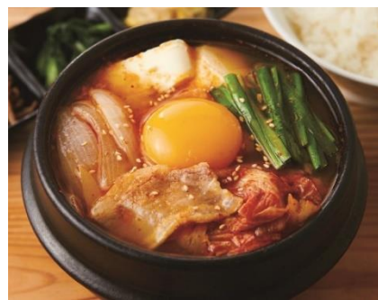
■石鍋豆腐チゲ （3種ナムル・ごはん付き） 850円（税込935円）