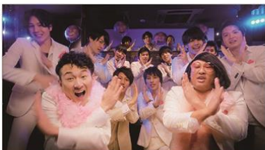
(秋山さん) ワイワイ祝い! なんにもない!