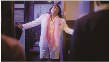
(秋山さん) 祝い入りませす