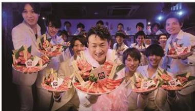
(馬場さん+コール隊) おめでとうございます!