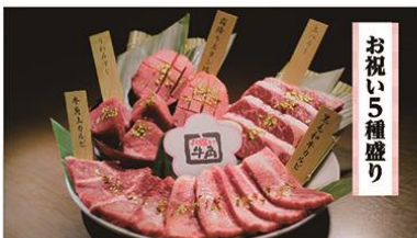
(秋山さん) 肉食べよう!