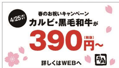
(ロバートさん) キャンペーン中!