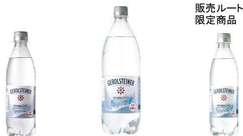
販売ルート 限定商品