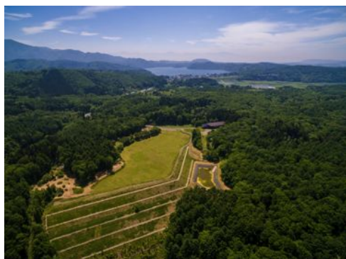
やすらぎの森オートキャンプ場(夏)

(*) フルフックアップ: 一般的に、電気、水道、排水の3つの設備が整っているキャンプ場のこと。やすらぎの森オートキャンプ場には、電気、水道、排水の他、Wi-Fi環境も整備されている。