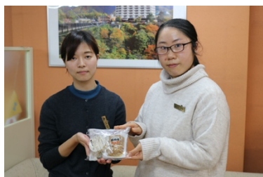
全従業員に配布し試食会