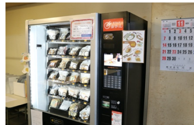
普段ご利用の自動販売機