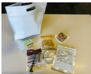
無料配布のお惣菜セット