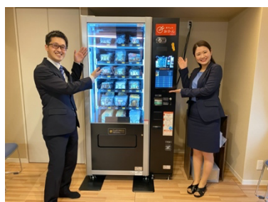
オフィスおかん自動販売機