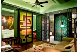
アット ギャラリー スイーツ