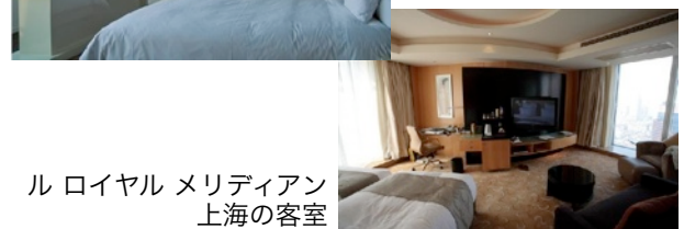
ル ロイヤル メリディアン上海の客室

また、旅のスタイル別ランキングには、ファミリー旅行におすすめのホテルに「ル ロイヤル メリディアン上海」、カップルにおすすめのホテルに、上海アールデコのインテリアが特徴的な「アット ギャラリー スイーツ」が、友人同士の旅におすすめのホテルには、1930年代に建てられた古いマンション（エンバンクメントハウス）をホテルとして利用している「チャイ 上海 リビング」が、それぞれ1位に選ばれました。