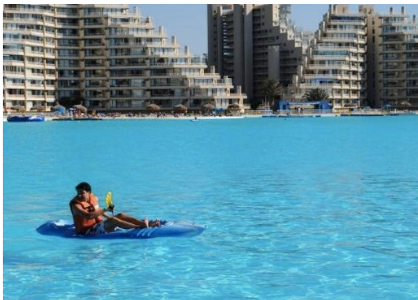
サン・アルフォンソ・テル・マル/チリ