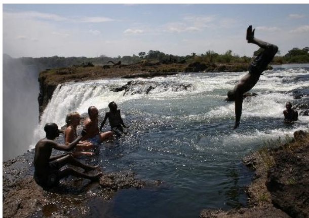
デビルズプール/ザンビア