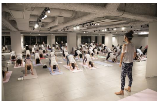
2017年に実施した国際ヨガの日イベントの様子

お子様連れのお客様には、託児所でのお子様の一時預かりを有料で実施します。ご希望の方は6/19迄に下記アドレスまでお問合せ下さい。(E-mail: mashnomori@mash-holdings.com )