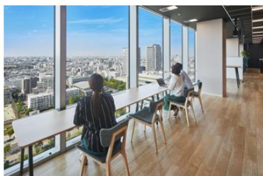
良好な眺望でリフレッシュ効果の高いカウンタースペース