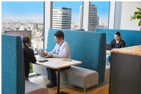
オープンな雰囲気で大画面ディスプレイを 備えるファミレス型

シーンに応じて使い分けられることのできる多彩なミーティングコーナーや、 開発作業に没頭できる1人用集中スペースを整備