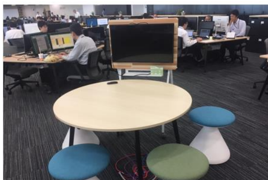
座席の近くで、すぐに打ち合わせができる スモール円卓型