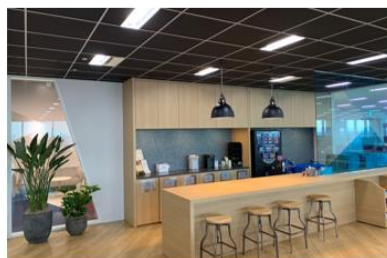
コーヒーを飲みながらのフランクなコミュニケーションに適したカフェスペース