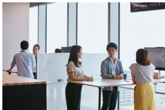
ミーティングの時間短縮や気分転換が 期待できるスタンディング型