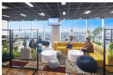
グリーンに囲まれ、リラックスした雰囲気での新たな発想を促すソファリビングスペース