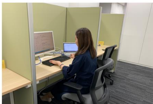
左右に仕切りがある1人用集中スペース