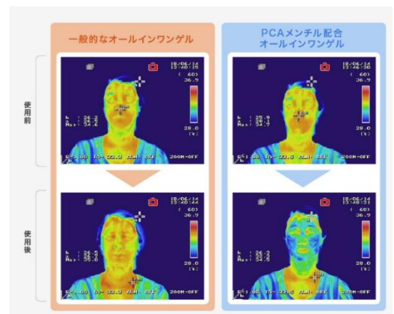
* ㈱メディプラス調べ

参照：メディプラス研究所/オフラボ調べ https://mediplus-lab.jp/