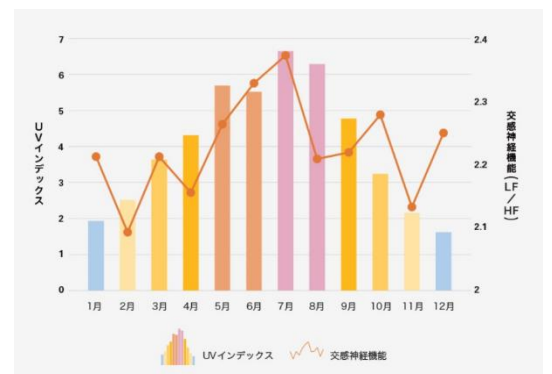
* 日最大 UV インデックス（解析値）の年間推移グラフ（気象庁より東京の2008～2017年の月別平均値を算出/スマホアプリ「COCOLOLO」による自律神経測定データ（WINフロンティア株式会社）より女性データを使用