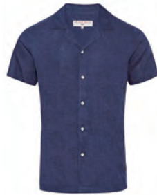
“THUNDERBALL” CAPRI SHIRT