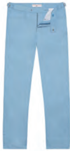
“DR. NO” TROUSERS