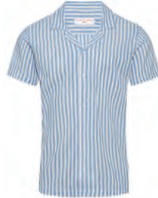
“THUNDERBALL” STRIPE SHIRT