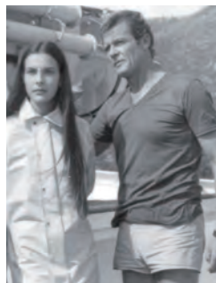
“FOR YOUR EYES ONLY” SWIM SHORTS