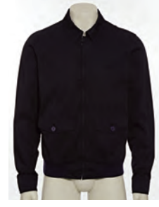
“OCTOPUSSY” HARRINGTON JACKET