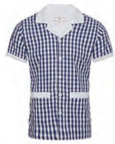
“THUNDERBALL” GINGHAM SHIRT