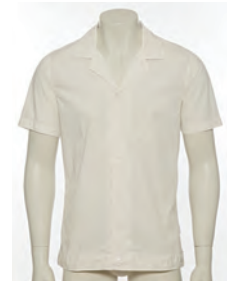
“THE MAN WITH THE GOLDEN GUN” CAPRI SHIRT