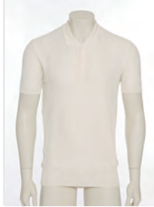
“DR. NO” KNITTED POLO