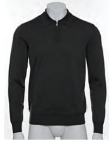
“MOONRAKER” KNITTED HALF-ZIP