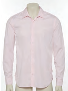
“YOU ONLY LIVE TWICE” SHIRT