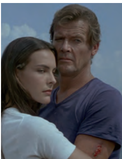
“FOR YOUR EYES ONLY” T-SHIRT