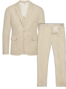
“ON HER MAJESTY’S SECRET SERVICE” LINEN SUIT