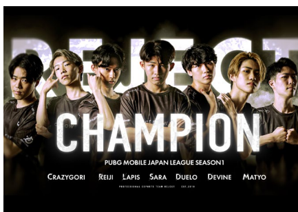
プロeスポーツチーム「REJECT」