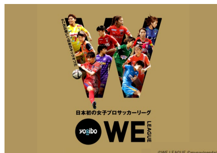
日本初の女性プロサッカーリーグ「WEリーグ」