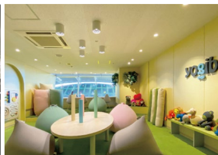
安心して観戦できる「センサリールーム」