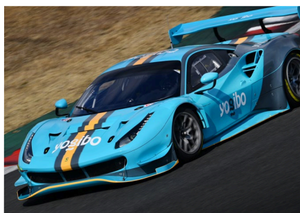
Yogibo Racing 2022 参戦車両

Yogibo は「Yogibo Racing」として『Fanatec GT World Challenge Asia Powered by AWS』への参戦が決定いたしました。また、日本初の女性プロサッカーリーグ「WE リーグ」、プロ e スポーツチーム「REJECT」や日本初開催のアクションスポーツ大会「X Games Chiba 2022」などへの協賛を行っております。さらに聴覚や視覚など感覚過敏の症状がある人でも安心して落ち着いた環境でスポーツ観戦を楽しむことができる「センサリールーム」のプロデュース・普及活動、被災地への支援活動や持続的な社会課題の解決を共に目指す「TANZAQ (タンザク)」プロジェクトなど、社会への貢献を通して“ストレスのない社会を実現する”ことを目指し活動しております。