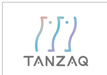
持続的な社会課題解決を目指す広告「TANZAQ」