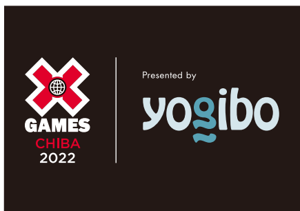
日本初開催のアクションスポーツ大会「X Games」