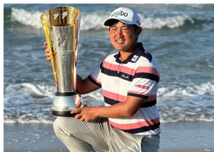
プロゴルファー金谷拓実選手 所属契約