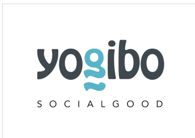
商品売上の5%を社会課題の解決に 「Yogibo Social Goodクーポン」

【Yogibo Social Good「TANZAQ(タンザク)」: https://tanzaq.jp/ 】