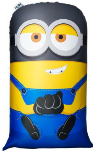
Minion Yogibo Midi Masked Ron (覆面ロン) changeable cover