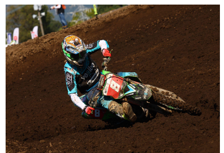
全日本モトクロス参戦チーム 「マウンテンライダーズ」メインスポンサー