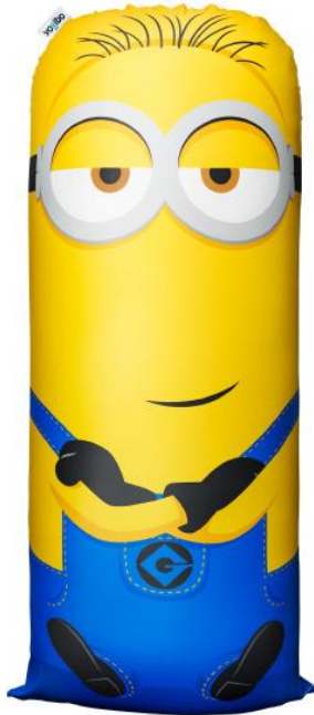
Minion Yogibo Max Tim (ティム) changeable cover