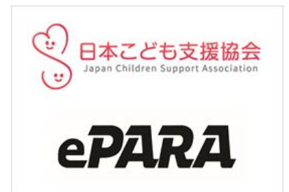
TANZAQ で広告出稿している社会团体（一部）