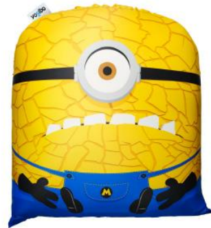
Minion Yogibo Mini Mega Jerry (メガジェリー) changeable cover

日本上陸10周年を記念して、映画『怪盗グルーのミニオン超変身』に登場するキャラクター (Tim・MaskedRon・MegaJerry) のYogiboオリジナルミニオンカバー(非売品)が手に入るプレゼントキャンペーンを実施いたします。