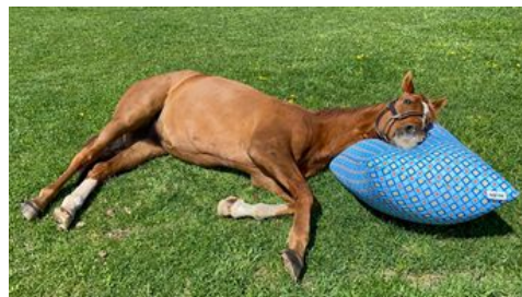
引退馬の余生を支援する活動 Yogiboヴェルサイユリゾートファーム