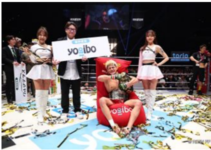
超RIZINを含む、RIZINナンバーシリーズ 2024 年間冠スポンサー