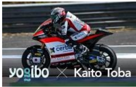
世界選手権 MotoGP参戦 オートバイレーサー 鳥羽海渡選手 スポンサー契約