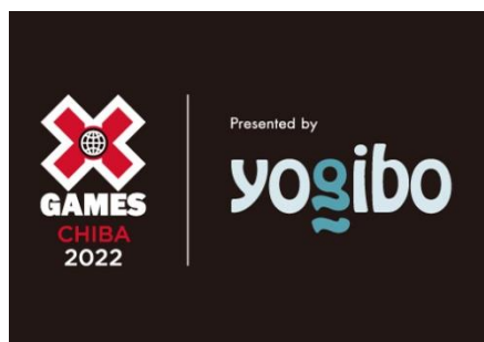
日本初開催のアクションスポーツ大会「X Games」