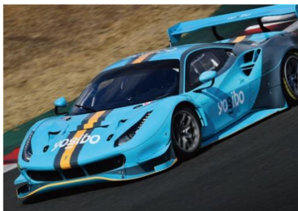
Yogibo Racing 2022 参戦車両

Yogibo パートナーシップ： https://yogibo.inc/csv/