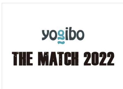
格闘技イベント「THE MATCH 2022」