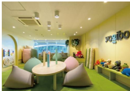
安心してスポーツ観戦できる「センサリールーム」

Yogibo social good 「TANZAQ（タンザク）」： https://tanzaq.jp/