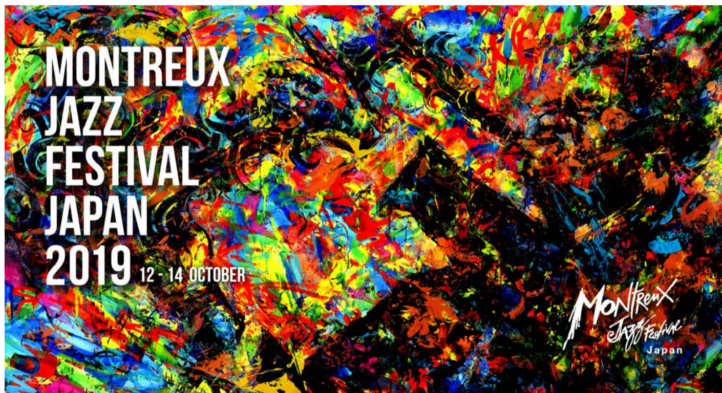
2019年のMJFJキービジュアル