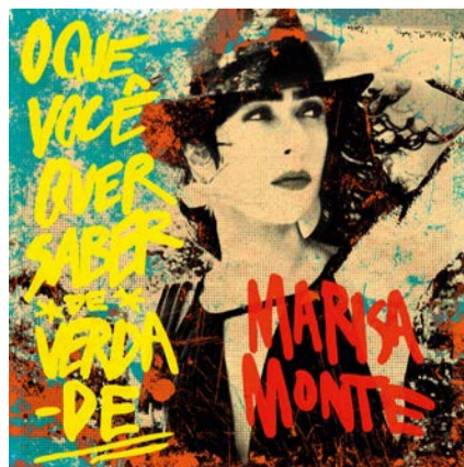
「あなたが本当に知りたいこと」 マリーザ・モンチ