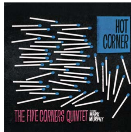
「ホット・コーナー」 ファイブ・コーナース・クインテット