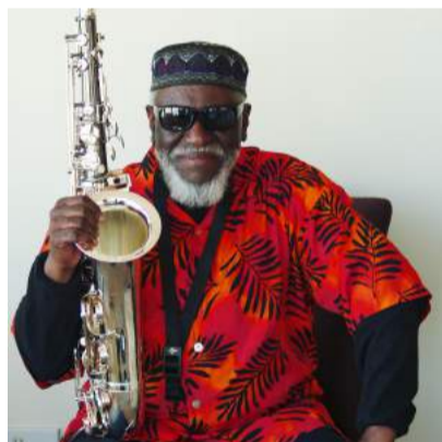
ファラオ・サンダース

2019年からは東京・日本橋三井ホールをメイン・ステージとして装いも新たに開催！ 話題の最新スポットをどのような音楽が彩るのか・・・詳細は5月の第一弾発表を楽しみにしてほしい。