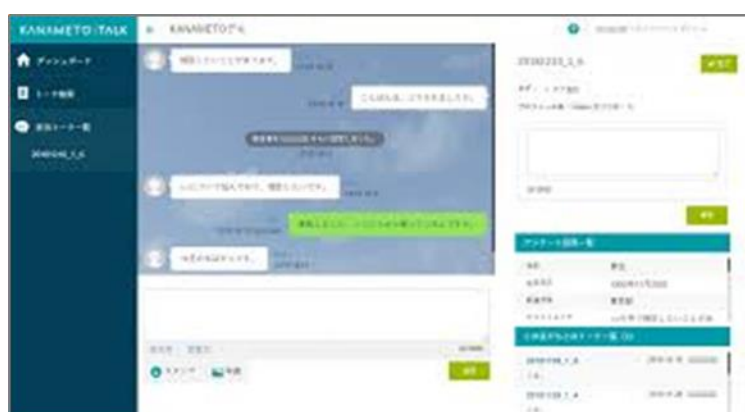
KANAMETO / LINE 公式アカウントによる学習相談画面イメージ

また、トモノカイが別途保有する留学生 DB を活用し、文化による教育格差解消に向けた外国人生徒向けの学習相談・学校生活相談のサポートも検討中です。