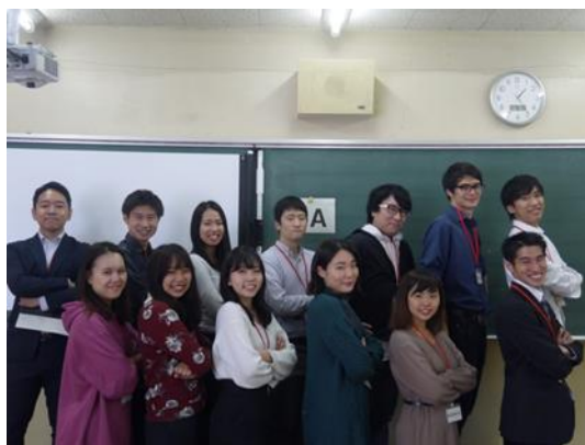
トモノカイ学習メンターチーム @未来の教室事業