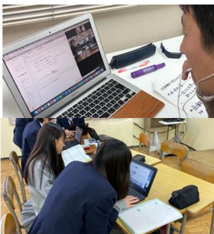
オンラインでの学習サポートイメージ

内容： STEAM プロジェクト学習における個別相談、教科学習の関する相談、進路に関する相談