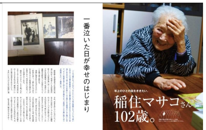
※「楽歳（らくさい）」創刊号・巻頭特集&目次ページ