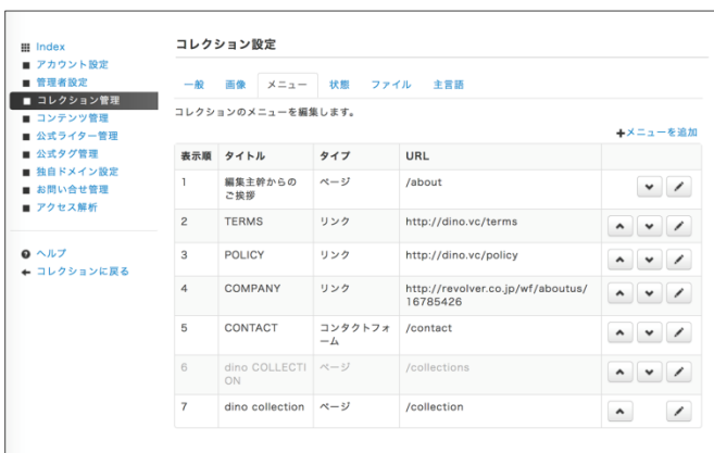
メディア管理画面

トランスコスモスとリボルバーでは、この提携により、今後 1 年間で 100 社への導入を目指します。