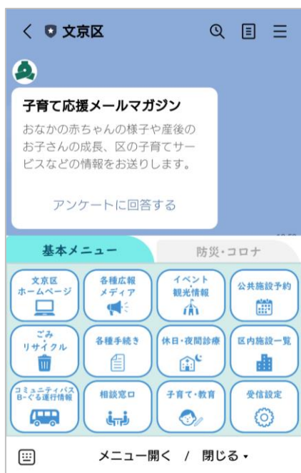
文京区 LINE 公式アカウント リッチメニュー