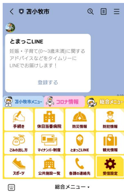
苫小牧市 LINE 公式アカウントのリッチメニュー