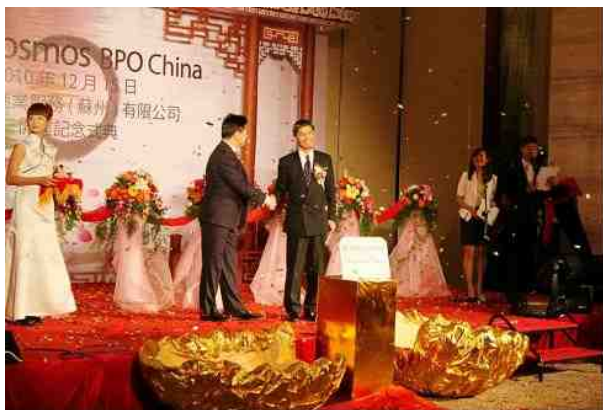
<開所式 起動式の様子>

『この蘇州工業園区において、大宇宙商業服務(蘇州)有限公司の盛大な開所式典を行っていただき、大変光栄です。心から感謝しております。蘇州工業園区は産業改革を積極的に推し進めており、革新型経済とサービス型の経済を発展させ、地域経済社会を目指しています。中でも中国のアウトソーシング模範基地のトップクラスとなるよう努力しております。今後は、「高効率、透明、公平、規範」という理念の下、積極的に支援いたします。大宇宙商業服務(蘇州)有限公司が、蘇州市、そして華東地区トップのアウトソーシングサービス企業となるよう共に歩んで行けたらと考えております。』