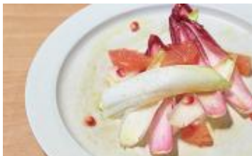
ラディッキオ、チコリ、 アーモンドケフィアの シトラスサラダ 価格：¥1,200

抗酸化作用の高い有機野菜とグレープフルーツとの コラボレーションが体をデトックスいたします。