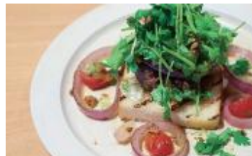
ラムパテ&アボカドワカモレ、 トマトサルサの ライスブレッドオープンサンド 価格：¥1,500

抗酸化作用の高い有機野菜とグレープフルーツとの コラボレーションが体をデトックスいたします。