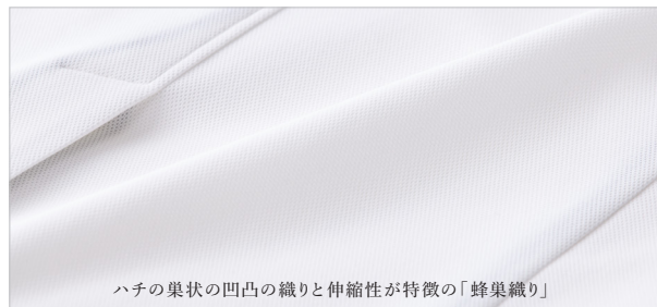
ハチの巣状の凹凸の織りと伸縮性が特徴の「蜂巢織り」