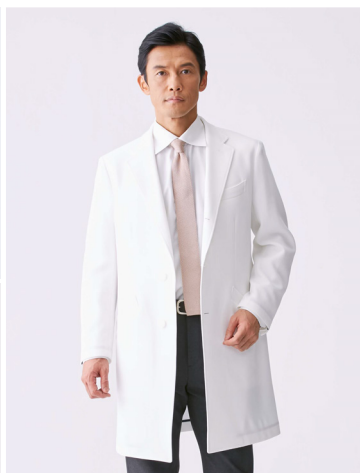
MENS クラシコテーラー・ブライトコットン Classico Tailor BRIGHT COTTON