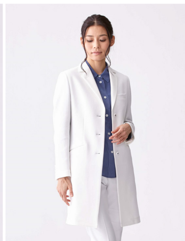
LADIES ヌードフィット・ブライトコットン Nude Fit BRIGHT COTTON