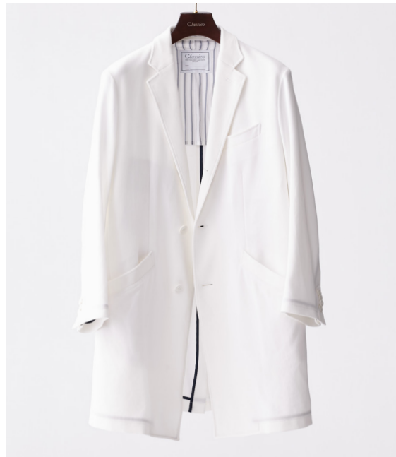
BRIGHT COTTON 白衣

誕生の背景には、2008年の創業時に綿100%の白衣づくりからスタートしていた経緯があります。当時主流であったポリエステル100%の白衣と差別化を図り、着心地の良さとデザイン性を最優先に考え大きな反響を呼んだものの、綿のデメリットであるシワ、ストレッチ性などの課題点が残り、研究を繰り返してきました。そして創業から8年、綿100%を求める医師の声も多い中、通気性・吸水性・肌触りに優れた日本伝統の「蜂巢織り」をベースに改良を加え、アイロンいらずの綿100%素材の白衣の開発に成功。織り技術によるストレッチ性も実現し、医師の要望をクリアした理想のコットンウェアが誕生いたします。