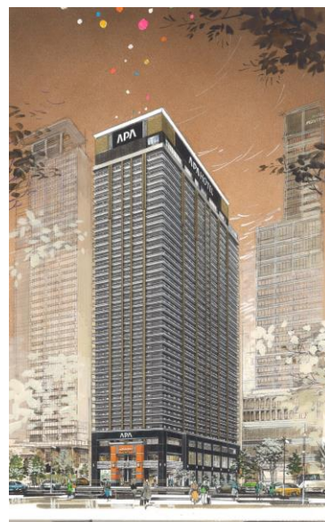
■ 最上階屋外展望プール、サウナ付大浴場を用意。(画像はイメージ)

予約受付開始を記念し、「開業記念プラン」をアパ直(公式サイト・アパアプリ)限定で販売する。また「アパ直クーポン」にて、当ホテルのご予約時に使用できる「大阪なんば駅前タワー 開業記念1,000円割引クーポン」を2,055枚限定で発行する。