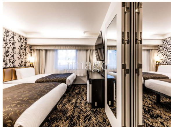
■ T-T コネクトフォースルーム (4ベッド) イメージ

ベッド、テレビ、バス (シャワー)、トイレが2つずつあるため、女子旅、グループ旅行、家族旅行でご好評いただいております。また、必要に応じて内鍵をかけることができ、各自のプライベートを確保しつつも多人数でのご利用が可能です。