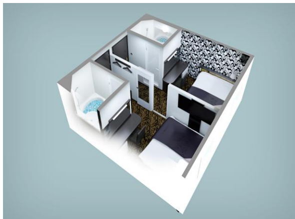
■ S-S コネクトツインルーム (2ベッド) 俯瞰イメージ

プルルームなど様々な部屋タイプを用意。なかでも、隣り合う客室を繋げて最大4名様で利用できるコネクティングルームはアパホテルとして過去最大の約400室(200組)設けており、グループ旅行や家族旅行など複数名の宿泊需要にも対応する。