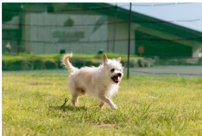
ドッグラン (約 160㎡)