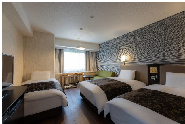
ステイウィズドッグルーム (トリプル)