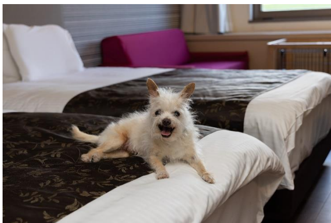
ステイウィズドッグルーム (ツイン / トリプル)