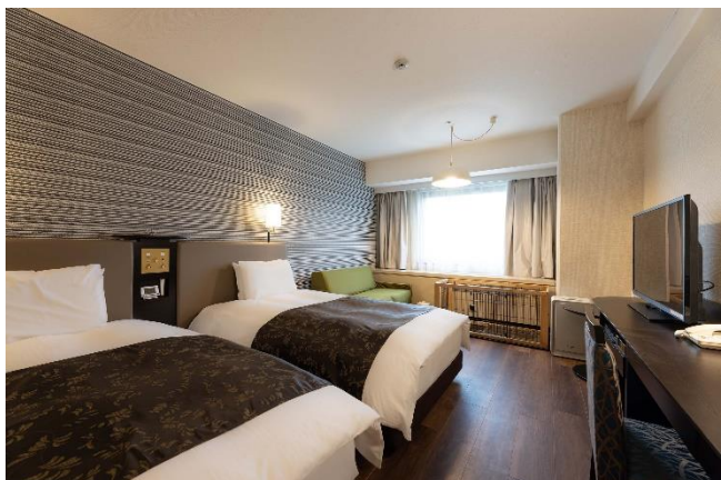
ステイウィズドッグルーム (ツイン)

また、ドッグランのリニューアルに伴い、ペット用プールを7月中旬に向けて新設する他、毎月29日(肉球の日)にステイウィズドッグルームへご宿泊されたお客様に、ペットの肉球を人の手のように、いつでも気軽に優しくケアすることのできる肉球レスキュー(1室1個)をプレゼントするキャンペーンも実施する。