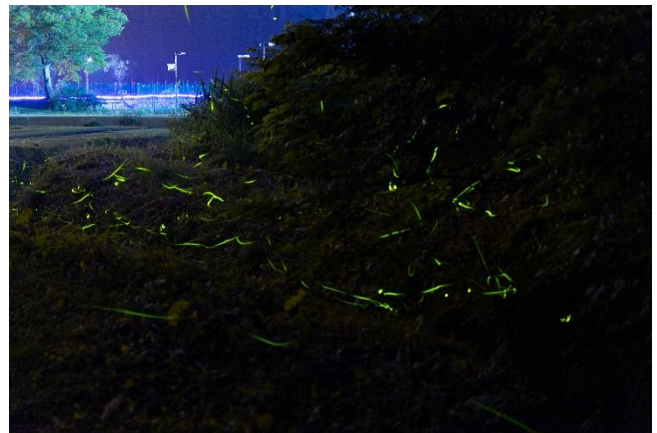
ホテル観賞ツアー